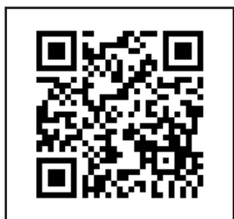
バースデーネーション