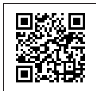
「わたしとそっと」記事集